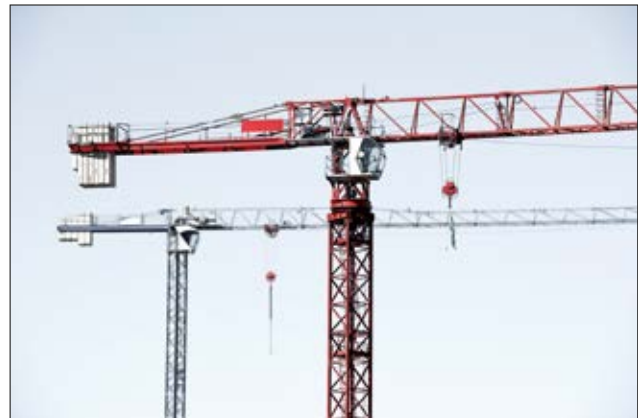
HelaGuard LTS galvanisierter Stahlschutzschlauch mit glattem PVC-Mantel für flüssigkeitsdichte Lösungen.