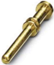
压接插针，车削，单个插针，触点直径: 2 mm，压接范围: 0.25 mm 2 ... 1 mm 2

Please be informed that the data shown in this PDF Document is generated from our Online Catalog. Please find the complete data in the user's documentation. Our General Terms of Use for Downloads are valid ( http://download.phoenixcontact.com )