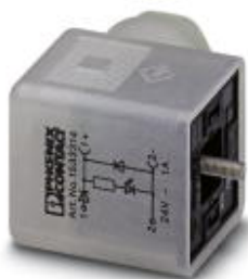
阀连接器, 3-芯, A 阀插头, 与 1个LED, 与.....连接 阻尼二极管, 螺钉连接, 电缆密封 Pg9, 电缆外径 6 mm ... 8 mm

Please be informed that the data shown in this PDF Document is generated from our Online Catalog. Please find the complete data in the user's documentation. Our General Terms of Use for Downloads are valid ( http://download.phoenixcontact.com )