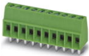
图为10位穿墙式连接器

固定式连接器，标称工作电流: 6 A，标称工作电压: 160 V，针距: 2.54 mm，位数: 5，接线方式: 带压片的螺钉连接，安装: 波峰焊，导线 / PCB连接方向: 0°，颜色: 绿色