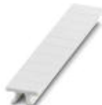
快速标记条，接头，白色，未标记，适用的打印机：PLOTMARK，CMS-P1-PLOTTER，安装方式: 卡接到高型标记槽，适用的模块宽度：5.2 mm，标识区域大小: 5.1 x 10.5 mm