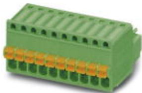
图为10位穿墙式连接器

插拔式连接器，标称工作电流: 4 A，位数: 4，针距: 2.5 mm，接线方式: 直插式弹簧连接，颜色: 绿色，触点表面: 锡