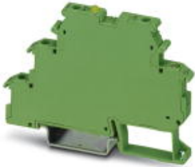
大功率固态继电器端子，输入：5 V DC，输出：3 - 30 V DC/3 A，端子宽度：6.2 mm

Please be informed that the data shown in this PDF Document is generated from our Online Catalog. Please find the complete data in the user's documentation. Our General Terms of Use for Downloads are valid ( http://download.phoenixcontact.com )