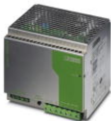
24V DC/20A DIN导轨安装式电源，初级开关模式，3相。

Please be informed that the data shown in this PDF Document is generated from our Online Catalog. Please find the complete data in the user's documentation. Our General Terms of Use for Downloads are valid ( http://download.phoenixcontact.com )