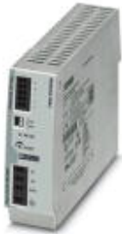
采用直插式连接的TRIO POWER开关电源，适于DIN导轨安装，三相输入，输出：24 V DC/10 A

Please be informed that the data shown in this PDF Document is generated from our Online Catalog. Please find the complete data in the user's documentation. Our General Terms of Use for Downloads are valid ( http://download.phoenixcontact.com )