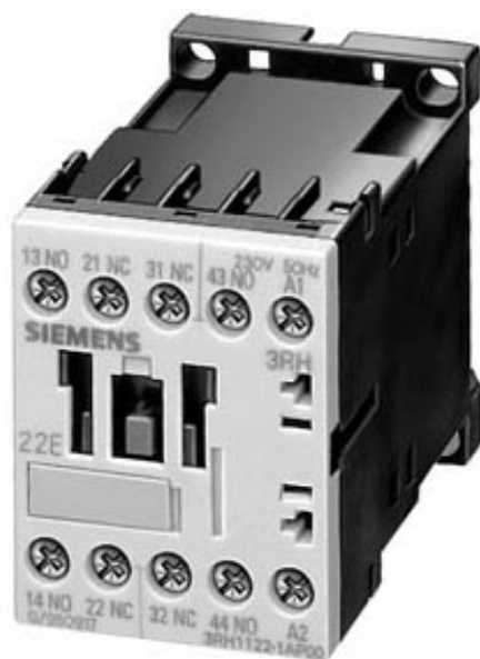
CONTACTOR RELAY, 2NO+2NC, DC 24 V, SCREW CONNECTION, SIZE S00