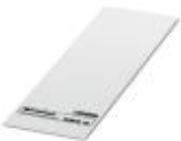
标记卡，卡，白色，未标记，适用的打印机：CMS-P1-PLOTTER，安装方式: 卡接到高型标记槽，卡接到扁平式标记槽，适用的模块宽度：6 mm，标识区域大小: 6 x 6.1 mm