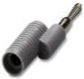
转换桥接件，颜色: 灰色