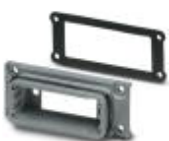
D-SUB面板安装支架，外壳尺寸2，IP67防护等级