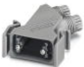
D-SUB插头外壳，外壳尺寸2，IP67防护等级