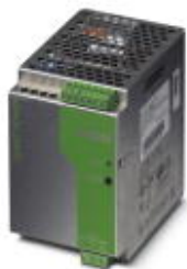
24V DC/10A DIN导轨安装式电源，初级开关模式，1相。

Please be informed that the data shown in this PDF Document is generated from our Online Catalog. Please find the complete data in the user's documentation. Our General Terms of Use for Downloads are valid ( http://download.phoenixcontact.com )