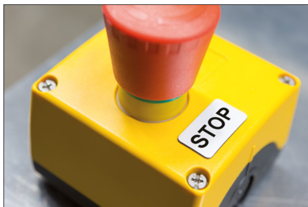
Les Panel Label sont idéales pour remplacer les plaques gravées.