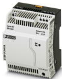
用于DIN导轨安装的STEP POWER电源，初级开关模式，输入：1相，输出：24 V DC/2.5 A

Please be informed that the data shown in this PDF Document is generated from our Online Catalog. Please find the complete data in the user's documentation. Our General Terms of Use for Downloads are valid ( http://download.phoenixcontact.com )