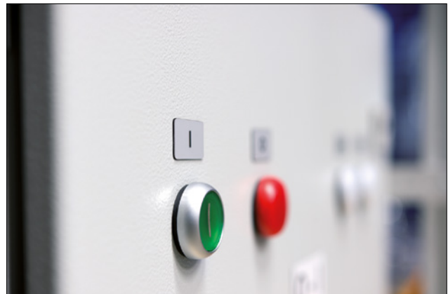
Les Panel Label sont idéales pour remplacer les plaques gravées.