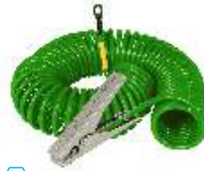
VESX45 / 5m Kabel

Edelstahl-Erdungsklammer VESX45 mit Cen-Stat-Kabel, Länge 3 Meter. Klammerabmessungen: 120 mm RS Stock Code: 737-9619