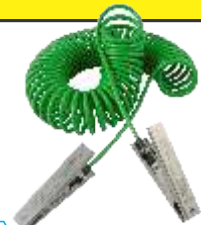
2 x VESX45 / 3m Kabel

Edelstahl-Erdungsklammer VESX45 mit Cen-Stat-Kabel, Länge 5 Meter. Klammerabmessungen: 120 mm RS Stock Code: 385-673