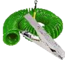
VESX90 / 5m Kabel

Edelstahl-Erdungsklammer VESX45 oder VESX90 mit gut sichtbarem Kabel, Länge 6,1 Meter, 9,2 Meter oder 15,2 Meter RS Stock Codes: 7800006 7800012 7800015 7800018