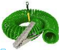
VESX45 / 3m Kabel

! WARNUNG ! - Fässer und Behälter verfügen typischerweise über Beschichtungen mit einer Stärke von 675 Mikrometern . Produktablagerungen an Fässern und Behältern können zu Schichtdicken von mehreren Millimetern führen. Die flachen Oberflächen von Schweiß- und Batterieklemmen sind nicht für das Durchdringen derartiger Schichten ausgelegt. Es ist äußerst wichtig, Erdungsklammern zu spezifizieren, die dauerhaft einen sicheren elektrischen Kontakt mit den leitenden Behälterteilen herstellen können. So kann sichergestellt werden, dass bei der Durchführung von Prozessen, bei denen es möglicherweise zur elektrostatischen Aufladung kommen kann, das Risiko einer Funkenentladung auf ein akzeptables Niveau gesenkt wird.