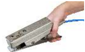
Bond-Rite / 5m Kabel

Edelstahl-Erdungsklammer VESX90 mit Cen-Stat-Kabel, Länge 5 Meter Klammerabmessungen: 235 mm RS Stock Code: 385-689