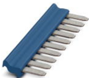
插拔式桥接件， 针距: 5.2 mm， 位数: 10， 颜色: 蓝色

Please be informed that the data shown in this PDF Document is generated from our Online Catalog. Please find the complete data in the user's documentation. Our General Terms of Use for Downloads are valid ( http://download.phoenixcontact.com )