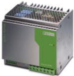
24V DC/20A DIN导轨安装式电源，初级开关模式，单相

Please be informed that the data shown in this PDF Document is generated from our Online Catalog. Please find the complete data in the user's documentation. Our General Terms of Use for Downloads are valid ( http://download.phoenixcontact.com )