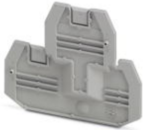
端板，长度: 69.9 mm，宽度: 2.2 mm，高度: 57.5 mm，颜色: 灰色

Please be informed that the data shown in this PDF Document is generated from our Online Catalog. Please find the complete data in the user's documentation. Our General Terms of Use for Downloads are valid ( http://download.phoenixcontact.com )