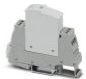
3型电涌保护，包括保护性连接器和底座元件，内置状态指示灯和用于单相电源网络的遥信。额定电压24 V AC/DC。

3类电涌保护设备 - PLT-SEC-T3-24-FM-UT - 2907916