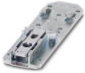
通用型DIN导轨适配器