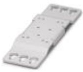
通用型壁挂式适配器，用于在振动极强的环境下安全安装电源。电源被直接拧接到安装面上。通用型壁挂式适配器装在顶部/底部。