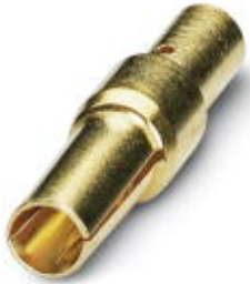
压接插针，车削，单个插针，触点直径: 1 mm，压接范围: 0.14 mm 2 ... 0.56 mm 2

Please be informed that the data shown in this PDF Document is generated from our Online Catalog. Please find the complete data in the user's documentation. Our General Terms of Use for Downloads are valid ( http://download.phoenixcontact.com )