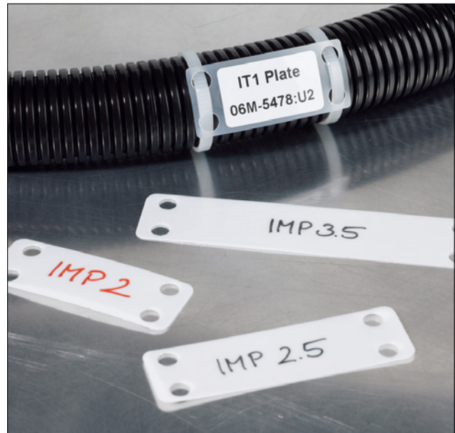
En sikker måde at mærke kabel, beskyttelsesslange og rør.