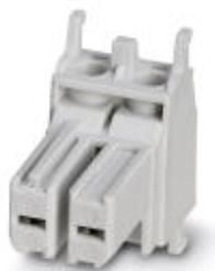
插芯模块，与插头端插芯支架配套，采用螺钉连接，2芯，400 V / 20 A

Please be informed that the data shown in this PDF Document is generated from our Online Catalog. Please find the complete data in the user's documentation. Our General Terms of Use for Downloads are valid ( http://download.phoenixcontact.com )