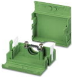
电缆插头外壳，针距: 0 mm，位数: 8，尺寸a: 40 mm，颜色: 绿色

Please be informed that the data shown in this PDF Document is generated from our Online Catalog. Please find the complete data in the user's documentation. Our General Terms of Use for Downloads are valid ( http://download.phoenixcontact.com )