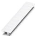
快速标记条，接头，白色，未标记，适用的打印机：PLOTMARK，CMS-P1-PLOTTER，安装方式: 卡接到高型标记槽，适用的模块宽度：6.2 mm，标识区域大小: 6.15 x 10.5 mm