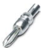
测试插头，带焊接连接，导线横截面最大1 mm 2 ，颜色: 灰色