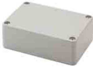
ABS机箱 Enclosure, ABS