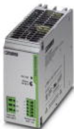
用于DIN导轨安装的TRIO POWER电源，初级开关模式，输入：1相，输出：48 V DC/5 A

Please be informed that the data shown in this PDF Document is generated from our Online Catalog. Please find the complete data in the user's documentation. Our General Terms of Use for Downloads are valid ( http://download.phoenixcontact.com )