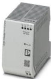
用于DIN导轨安装的UNO POWER电源，初级开关模式，输入：1相，输出：24 V DC/100 W

Please be informed that the data shown in this PDF Document is generated from our Online Catalog. Please find the complete data in the user's documentation. Our General Terms of Use for Downloads are valid ( http://download.phoenixcontact.com )