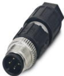
传感器/执行器连接器，通用，4-芯，插头 直头 M12，A编码，快速免剥线连接，螺圈材料: 锌铸，镀镍，电缆外径 3.5 mm ... 6 mm

Please be informed that the data shown in this PDF Document is generated from our Online Catalog. Please find the complete data in the user's documentation. Our General Terms of Use for Downloads are valid ( http://download.phoenixcontact.com )