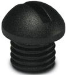
M5旋入式封盖，用于传感器 / 执行器电缆、分线盒和插座上未使用的M5连接位

Please be informed that the data shown in this PDF Document is generated from our Online Catalog. Please find the complete data in the user's documentation. Our General Terms of Use for Downloads are valid ( http://download.phoenixcontact.com )