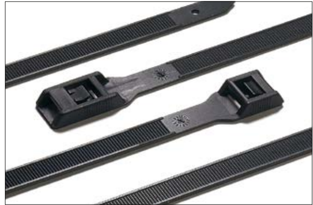
PE-, RPE-Serie mit flacher Kopfgeometrie.