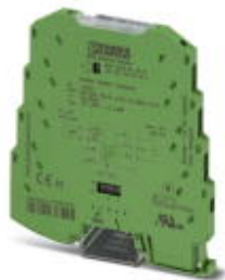
MCR位置变送器将电位计位置转换成标准模拟量信号，0Ω输入... 100Ω到0kΩ ... 100kΩ

Please be informed that the data shown in this PDF Document is generated from our Online Catalog. Please find the complete data in the user's documentation. Our General Terms of Use for Downloads are valid ( http://download.phoenixcontact.com )