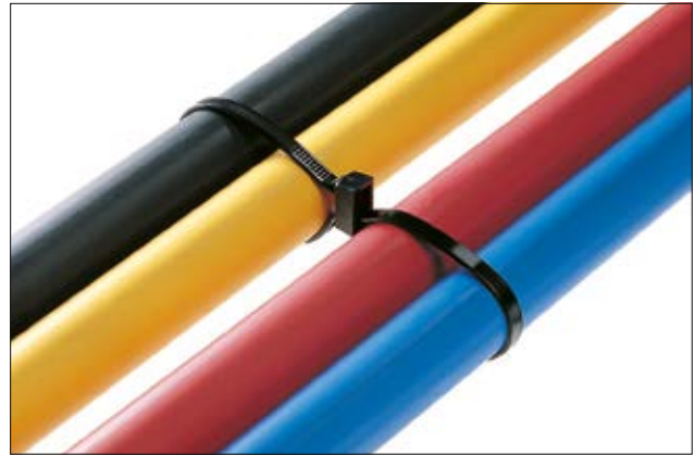
Parallele Bündelung mit Kabelbindern der DH-Serie. Es entsteht eine innen- und eine außenverzahnte Schlaufe durch den Doppelkopf.