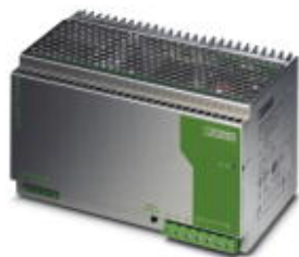
24V DC/40A DIN导轨安装式电源，初级开关模式，3相。

Please be informed that the data shown in this PDF Document is generated from our Online Catalog. Please find the complete data in the user's documentation. Our General Terms of Use for Downloads are valid ( http://download.phoenixcontact.com )