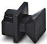
RJ45 孔式连接器的防尘盖