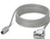
连接电缆，用于将控制器连接到PC (RS-232) 上 (用于带流量控制功能的PC WORX)，长度为3 m