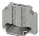
终端固定件，宽度：9.5 mm，颜色：灰色