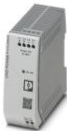
用于DIN导轨安装的UNO POWER电源，初级开关模式，输入：1相，输出：5 V DC/40 W

Please be informed that the data shown in this PDF Document is generated from our Online Catalog. Please find the complete data in the user's documentation. Our General Terms of Use for Downloads are valid ( http://download.phoenixcontact.com )