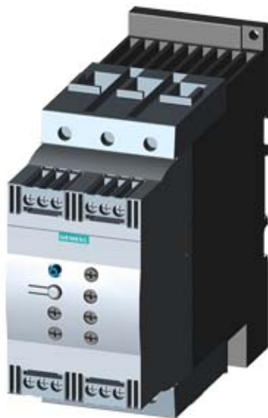
SIRIUS SOFT STARTER, S3, 80A, 45KW/400V, 40 DEGR., AC 200-480V, AC/DC 110-230V, SCREW TERMINALS