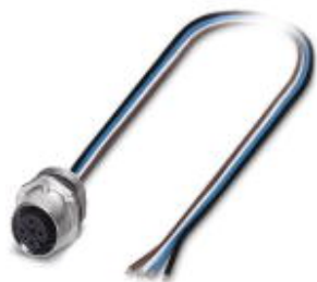
针式插座，通用，4-芯，孔式，直头，M12-SPEEDCON，A编码，板前安装，M16 x 1.5，单线，电缆长度：0.5 m

Please be informed that the data shown in this PDF Document is generated from our Online Catalog. Please find the complete data in the user's documentation. Our General Terms of Use for Downloads are valid ( http://download.phoenixcontact.com )