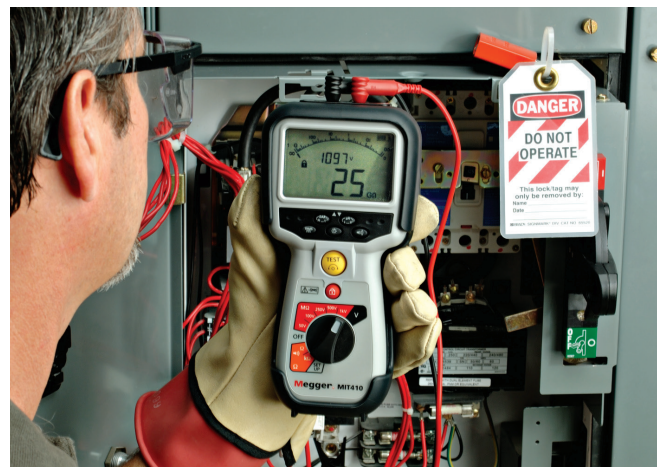
使用MIT400系列使配电板的测试更为快速、简单和安全。