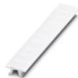
快速标记条，接头，白色，未标记，适用的打印机：PLOTMARK，CMS-P1-PLOTTER，安装方式: 卡接到高型标记槽，适用的模块宽度：6.2 mm，标识区域大小: 6.15 x 10.5 mm