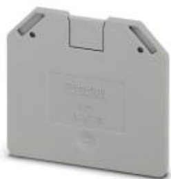
端板，长度: 52.8 mm，宽度: 2.2 mm，高度: 47.3 mm，颜色: 灰色

Please be informed that the data shown in this PDF Document is generated from our Online Catalog. Please find the complete data in the user's documentation. Our General Terms of Use for Downloads are valid ( http://download.phoenixcontact.com )