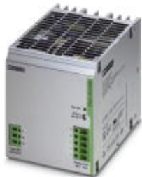
用于DIN导轨安装的TRIO POWER电源，初级开关模式，输入：1相，输出：48 V DC/10 A

Please be informed that the data shown in this PDF Document is generated from our Online Catalog. Please find the complete data in the user's documentation. Our General Terms of Use for Downloads are valid ( http://download.phoenixcontact.com )