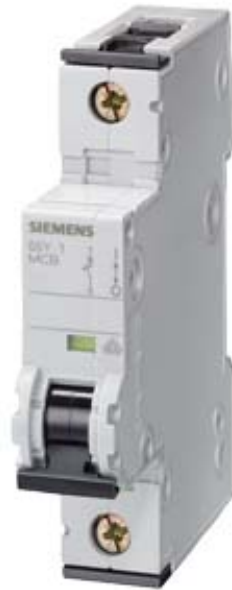
CIRCUIT BREAKER 230/400V 10KA, 1-POLE, B, 16A, D=70MM