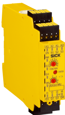
图片可能存在偏差