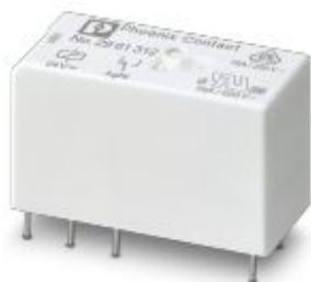
插拔式微型功率继电器，带有功率触点，适用于高持续电流，1个PDT，输入电压24 V DC

Please be informed that the data shown in this PDF Document is generated from our Online Catalog. Please find the complete data in the user's documentation. Our General Terms of Use for Downloads are valid ( http://download.phoenixcontact.com )