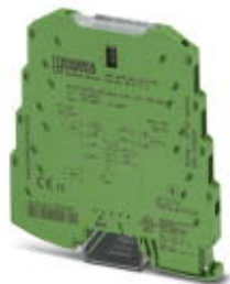
MCR 4端信号倍增器，用于模拟量信号的电气隔离和复制，螺钉接线，标准组态

Please be informed that the data shown in this PDF Document is generated from our Online Catalog. Please find the complete data in the user's documentation. Our General Terms of Use for Downloads are valid ( http://download.phoenixcontact.com )