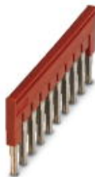
插拔式桥接件， 针距: 6.2 mm， 宽度: 60.3 mm， 位数: 10， 颜色: 红色

Please be informed that the data shown in this PDF Document is generated from our Online Catalog. Please find the complete data in the user's documentation. Our General Terms of Use for Downloads are valid ( http://download.phoenixcontact.com )