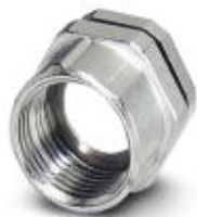
M12 SPEEDCON外壳螺钉连接，用于M12孔式插针，带O形环，适用于所有支持SPEEDCON的THR及波峰焊接插芯

Please be informed that the data shown in this PDF Document is generated from our Online Catalog. Please find the complete data in the user's documentation. Our General Terms of Use for Downloads are valid ( http://download.phoenixcontact.com )